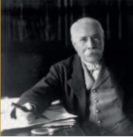
Sir Edward Elgar

die Natur und die Kunst als Trostspender. Der Nacht folgt der heitere Tag: weiß-blau, wie es sich für einen bayerischen Himmel gehört, geht unsere Reise zu Ende mit „From the Bavarian Highlands“, einer launigen musikalischen Impression eines Sommerurlaubs des Briten Edward Elgar in den bayerischen Alpen.